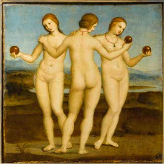
Raffaello Sanzio, Le tre Grazie , 1503-1504 (Museo Condé, Chantilly). Olio su tavola - 17 cm x 17 cm

La spontaneità e semplicità della composizione, da cui trae origine lo strano e sottile fascino dell'opera, nasce da un delicato, studiato e sottile equilibrio di ritmi nel sovrapporsi e rispecchiarsi dei corpi e dei movimenti delle tre Grazie. Esse occupano l'intero spazio della scena, su uno sfondo spoglio che serve soprattutto, con i suoi toni di terra bruciata e con il tono del cielo, a valorizzare i colori carnici dei nudi. Nelle Grazie di Raffaello si sente il movimento dello spazio attorno alle figure femminili, e girando attorno a loro ne possiamo percepire la perfezione e la rotondità dei corpi come e meglio che in gruppo scultoreo. Il piccolo dipinto di Raffaello riesce a raggiungere valori e dimensioni speciali non solo grazie alla costruzione geometrica, basata sulla "simmetria contrapposta", tipica dell'arte rinascimentale, quanto soprattutto all'eccezionale e del tutto originale equilibrio e bilanciamento dei corpi delle Grazie, che nelle perfette proporzioni, negli atteggiamenti, nei veli trasparenti e nei toni ocra del carnico, sottolineati dai coralli delle collane, evocano suggestioni di castità e sensualità insieme.