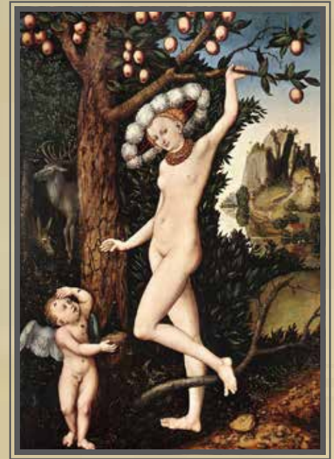
Lucas Cranach il Vecchio, VENERE E CUPIDO , 1529 (National Gallery, Londra). Olio su tavola - 81,3 x 54,6 cm

(Mario Perniola, Transiti - filosofia e perversione , Castelvecchi editore).