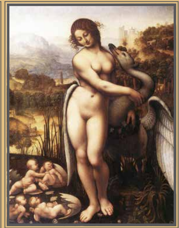
Cesare da Sesto (?), LEDA COL CIGNO , 1515-20 (Wilton House, Salisbury).