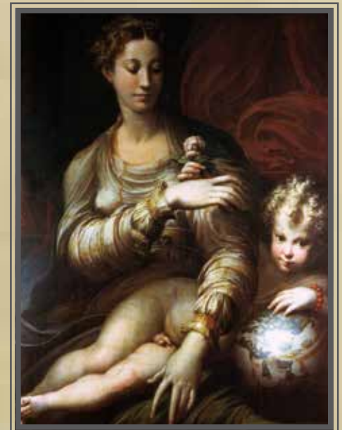
Girolamo Mazzola detto il Parmigianino, MADONNA DELLA ROSA , 1530 (Gemäldegalerie, Dresda). Olio su tavola - 109 x 88,5 cm