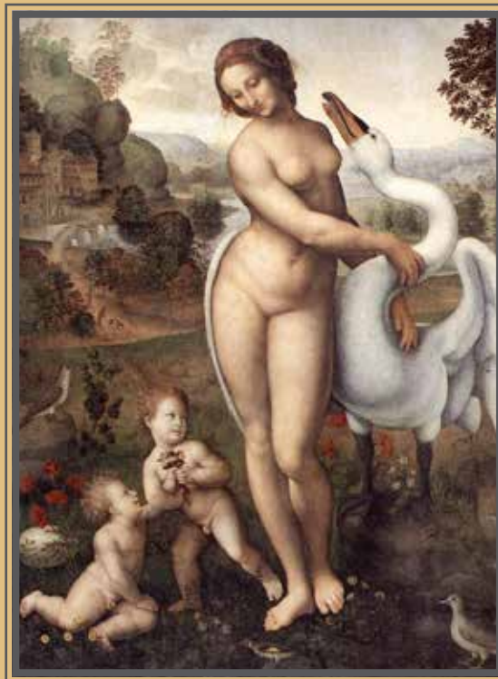
Giovanni Antonio Bazzi detto il Sodoma(?), LEDA COL CIGNO , 1510-20 (Galleria Borghese, Roma).