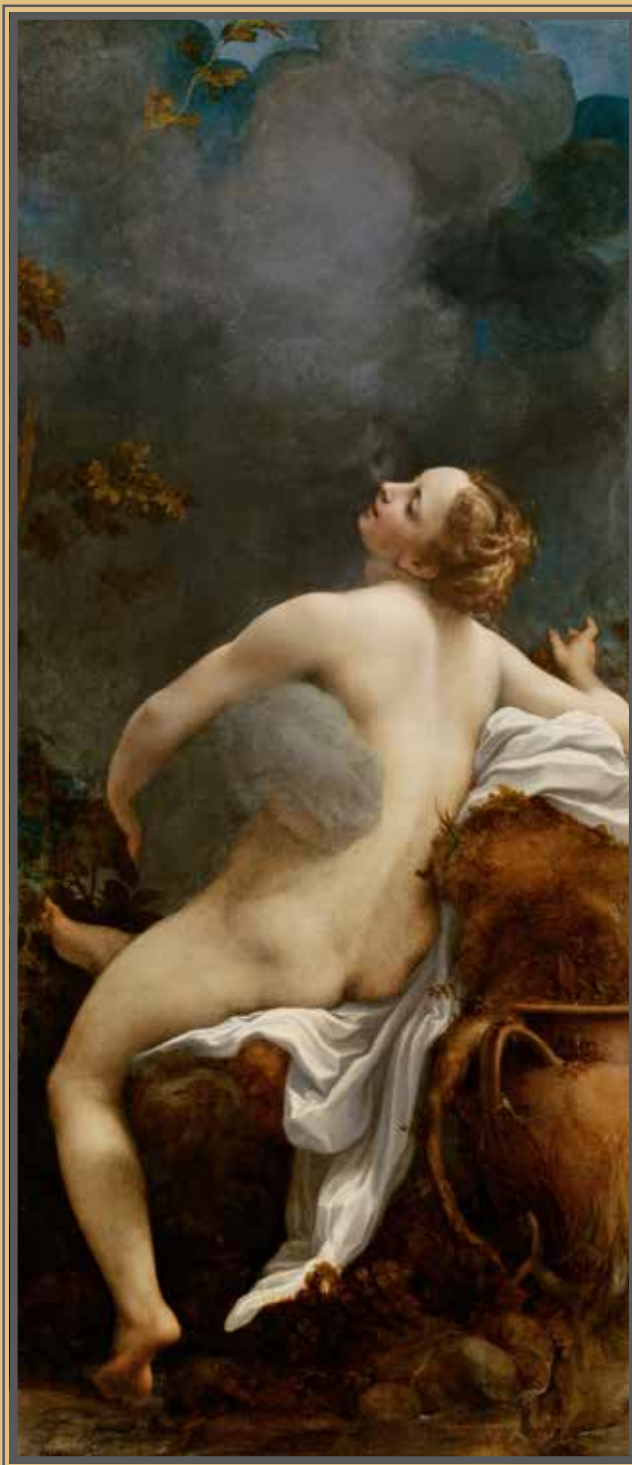
Antonio Allegri detto il Correggio, IO POSSEDUTA DA GIOVE , 1531 ca. (Kunsthistorisches Museum, Vienna). Olio su tela - 163,5 x 74 cm