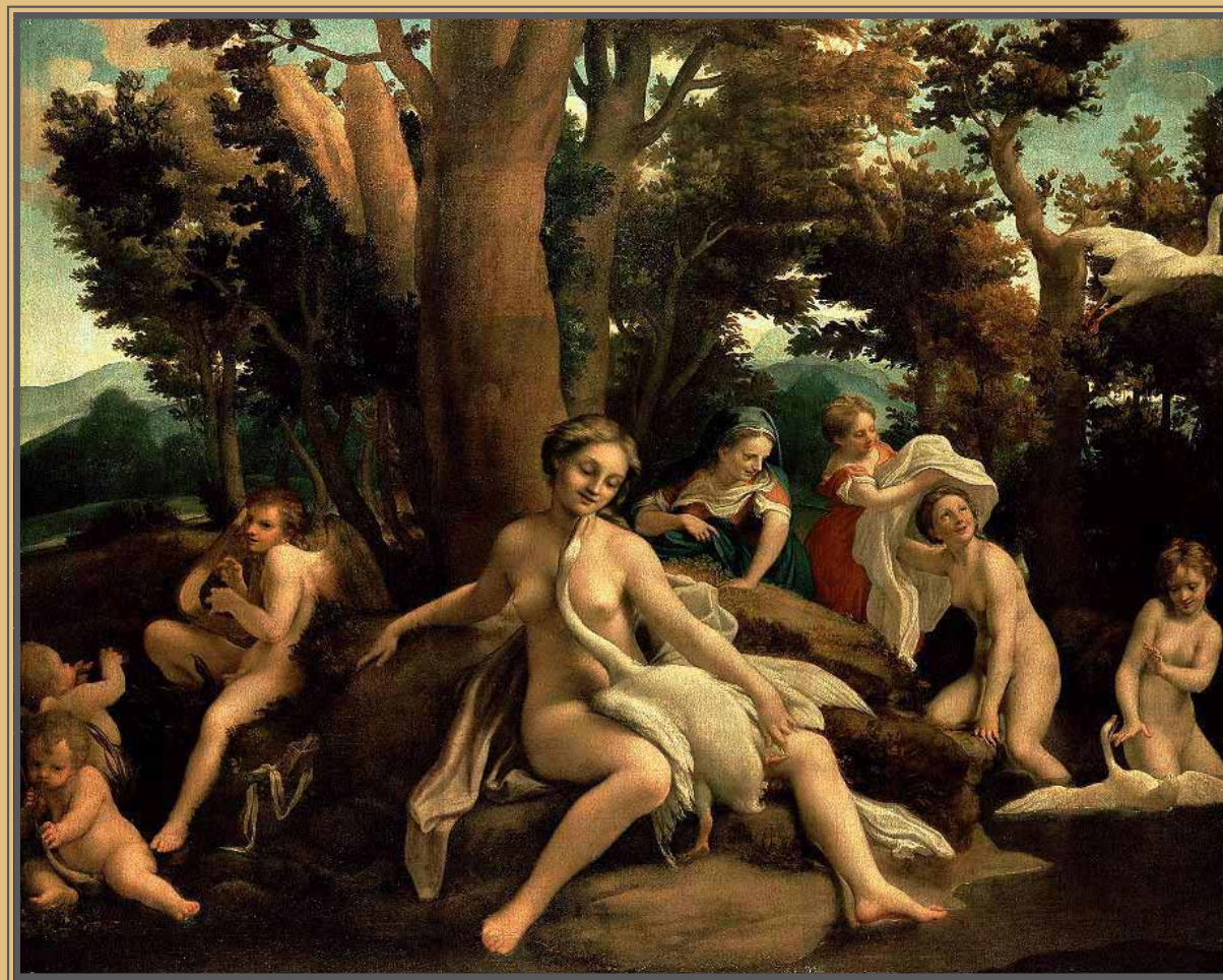
Antonio Allegri detto il Correggio, LEDA , 1520-31 (Gemäldegalerie, Berlino). Olio su tela - 152 x 191 cm