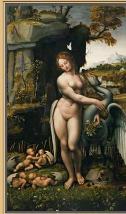
Francesco Melzi (?), LEDA COL CIGNO , 1505-07 (Galleria degli Uffizi, Firenze).