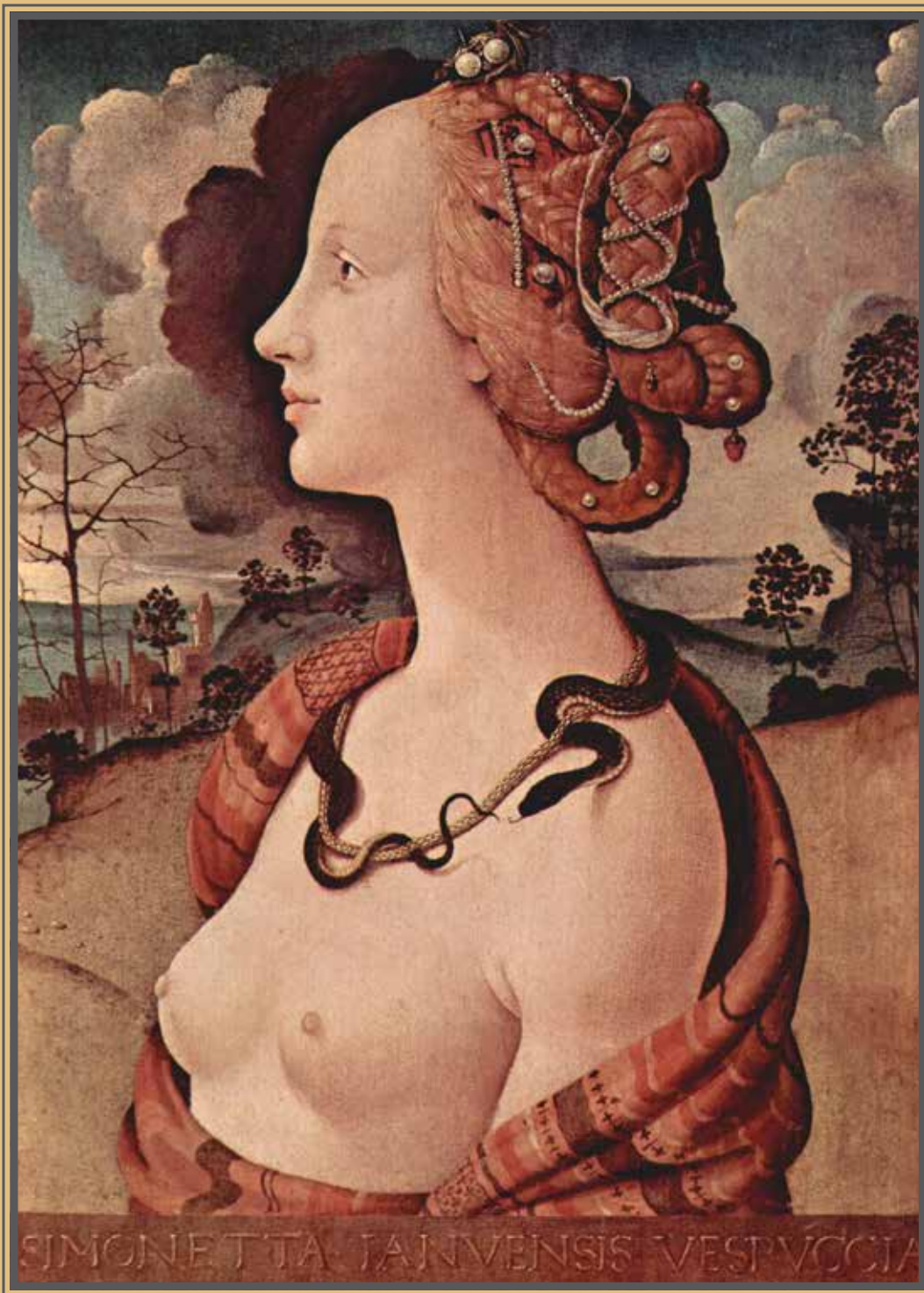
Piero di Cosimo, RITRATTO DI SIMONETTA VESPUCCI , 1480 ca. (Museo Condé, Chantilly). Tempera su tavola - 57 x 42 cm

Simonetta Vespucci, moglie di un cugino alla lontana di Amerigo Vespucci, fu modella e musa di artisti quali Botticelli e Piero di Cosimo, una donna alla cui bellezza tra il 1475 e il 1515 viene dedicata l'opera di più di tredici poeti, tra cui Angelo Poliziano e Lorenzo de' Medici. La ragazza è effigiata a mezza figura di profilo, voltata verso sinistra e sullo sfondo di un paesaggio aperto, arido a sinistra e rigoglioso a destra. Una nube scura esalta per contrasto il profilo purissimo del volto, dalla carnagione chiarissima. Tradizionalmente viene identificato come un ritratto nelle vesti di Cleopatra, per il seno scoperto e l'aspide attorcigliato al collo con il quale essa morì. Studi più recenti hanno però anche ipotizzato che la donna simboleggi Proserpina, col serpente che simboleggerebbe la speranza di resurrezione in chiave pagana. Stupisce la purezza dei lineamenti e la ricchezza dell'acconciatura, elaborata con treccine, nastri e perline. La fronte è altissima, secondo la moda del tempo che prevedeva la rasatura dell'attaccatura dei capelli. Il busto, secondo una tipologia quattrocentesca, è leggermente ruotato verso lo spettatore, in modo da favorire la visuale, ed è avvolto da un panno riccamente ricamato e intarsiato. Sul parapetto dipinto si legge un'iscrizione che imita lettere intagliate: SIMONETTA IANUVENSIS VESPUCCIA.