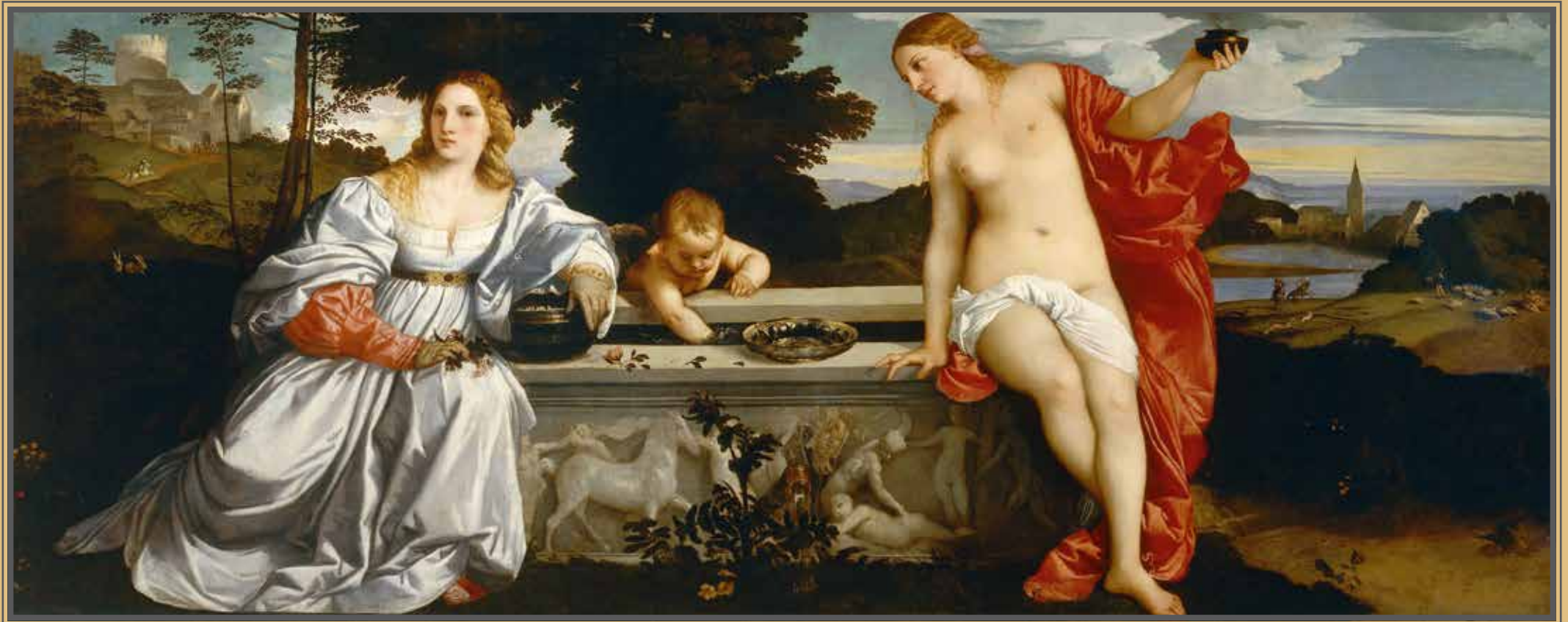
Tiziano Vecellio, L'AMOR SACRO E AMOR PROFANO , 1514 ca. (Galleria Borghese, Roma). Olio su tela - 118 × 279 cm